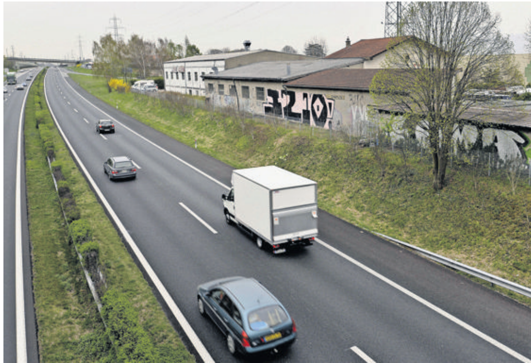
Les bâtiments enclavés entre la bretelle de l'autoroute et l'A1 devront être démolis. La propriétaire cédera son terrain à Schenk quand les locataires seront relogés. PATRICK MARTIN

Cela dit, les délais annoncés en novembre dernier sont déjà déca-